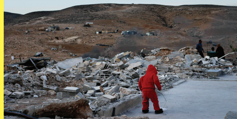
BARDZO BLISKI WSCHÓD